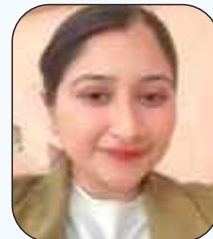
Prof. Katyayni Assistant Professor