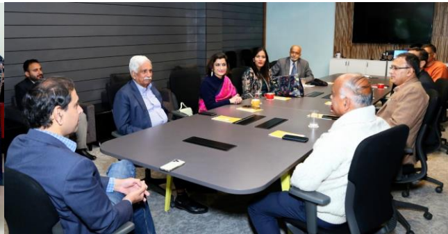
Mou Signed 09/03/2023