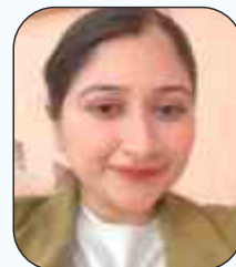
Prof. Katyayni Assistant Professor