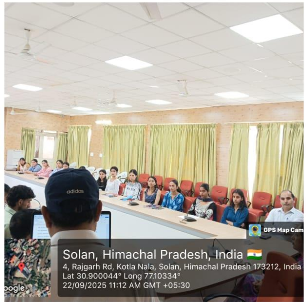
Faculty and students at the formation of 'Rishis of the Cosmos' Physics Department Society, Government College Solan.